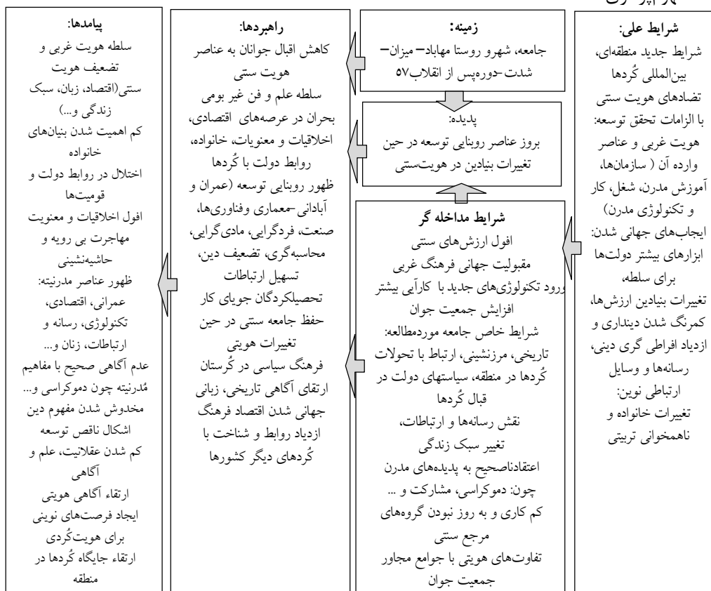
نمودار ۱. مدل پارادایمی توسعه

«در آخرین مرحله از گذگاری (گذگاری انتخابی)، از میان مقوله‌ها، مقوله محوری انتخاب می‌شود و حول آن نظریه‌ای ارائه می‌شود» (استراس و کوربین، ۱۳۸۷: ۱۱۸). مقوله اصلی در این تحقیق پس از تکمیل، اصلاح و ادغام کردن مقولات و زیرمقولات گذگاری انتخابی، بر ۲۷۹ محور استخراج شده و در نهایت ارتباط مقوله مرکزی با مقوله‌های فرعی در یک مدل پارادایمی مفهوم‌پردازی شده است: