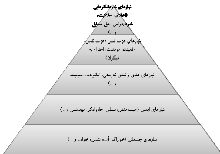
شکل ۱. سلسله‌مراتب نیازها از نظر مازلو

سلسله‌مراتبی است که عبارت‌اند از: نیازهای جسمانی، نیازهای ایمنی، نیازهای تعلق و عشق، نیازهای عزت نفس و نیازهای خودشکوفایی (مازلو، ۱۳۷۲: ۷۱).