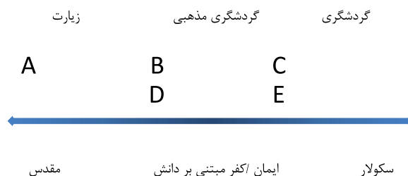
شکل ۱. زنجیره زیارت و گردشگری (اسمیت، ۱۹۹۲)

الگو نشان‌دهنده تمایلات و علایق متغیر مسافران است که می‌توانند در برهه‌ای گردشگر و در زمانی زائر باشند، بدون آنکه خود نیز از این امر آگاه باشند.