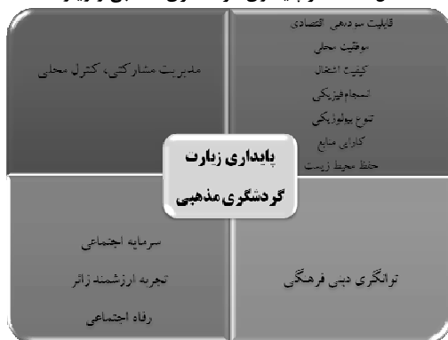
شکل ۳. عناصر پایداری گردشگری مذهبی و زیارت

به تاسی از مدل گردشگری پایدار (موننت، ۲۰۰۷)، حفظ پایداری مقصد زیارتی مستلزم توجه به دوازده بعد است که ذیل چهار بعد اصلی سیستم شهر زیارتی به شرح شکل ۳ طبقه‌بندی می‌شود.